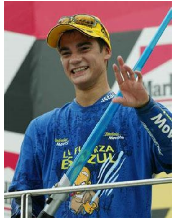
▲ ▼ Dani Pedrosa 29/09/1985, 12:15 GMT, Sabadell (41N33/02E07). Fuente: partida de nacimiento

En sus declaraciones a la prensa siempre ha infundido coherencia a la hora de hablar de sus objetivos (Sol y Mercurio tocando el medio cielo), valorando mucho el trabajo de su equipo técnico y mecánico. Siempre ha afirmado en las entrevistas que él practica un deporte individualista donde hay muchos intereses y el piloto ha de arriesgar al máximo para ser el mejor. Mercurio en signo de Libra, en dwad de Acuario, le da ese toque de concreción en sus declaraciones.