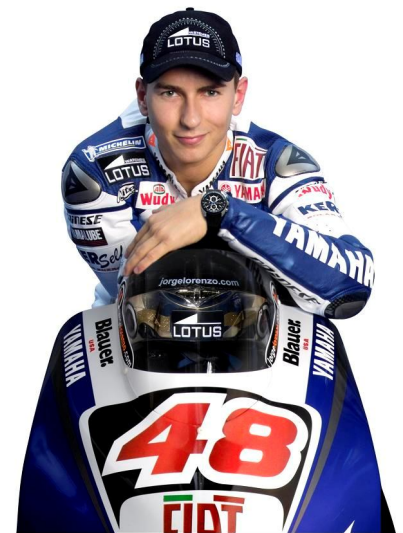
▲ Jorge Lorenzo 4/05/1987, 12:40 GMT, Palma de Mallorca (39N35/02E39). Fuente: partida de nacimiento